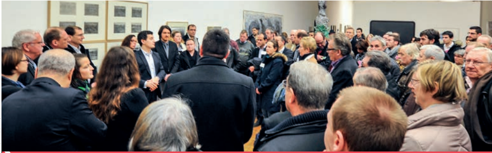
© William Lewis Le maire, Gérald Darmanin a réuni les habitants membres des Conseils de Quartier au MUba le 12 février 2015

En octobre le Conseil Municipal a voté le nouveau règlement des Conseils de Quartier. L'objectif était de les rendre plus représentatifs et pleinement ouverts aux habitants qui, depuis, se sont réunis pour voter pour ceux qui les représenteront au sein du bureau. Pour les associations et les acteurs économiques, un appel à candidatures a été lancé courant décembre. Le 14 février, le Conseil