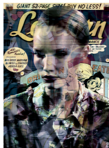
Valérie Belin, série All Star, Confessions of the Lovelorn, 2016, © Valérie Belin