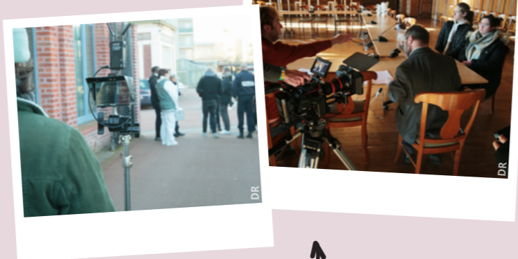
Tournage Series Mania

Du 11 février au 5 mars, les Tourquennois ont été nombreux à venir profiter de la foire d'hiver et de ses nombreuses attractions présentes sur le parvis Saint-Christophe. Le jeudi 16 février, les élus, en collaboration avec les forains, ont distribué des tickets à plusieurs enfants provenant de foyers de la ville afin de profiter de la foire d'hiver. Chaque enfant s'est vu recevoir 4 tickets manège et 1 gourmandise.