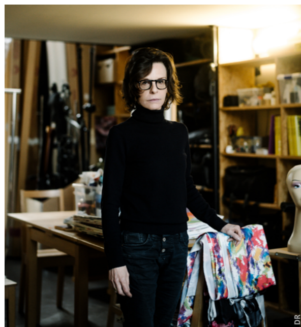
Valérie Belin, 2020

En 2023, le MUba Eugène Leroy met à l'honneur une autre facette de l'art : la photographie. Les œuvres de Valérie Belin seront ainsi mises à l'honneur du 17 mars au 27 août au travers d'une centaine de photographies retraçant son parcours des années 1990 à nos jours.