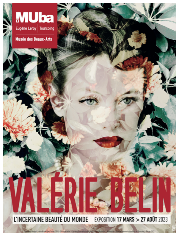
Valérie Belin, 2020, © Frédéric Stucin

Interrogeant notre perception du monde au travers de l'image, Valérie Belin explore l'illusion de la beauté plastique dans un univers paradoxal et ambigu. À la fois troublantes et déstabilisantes, les photographies, jouant avec de multiples possibilités (noir et blanc, surimpression, modification chromatique, cadrage, etc.), nous donnent à voir un monde façonné par les dictats de la société (beauté, performance, perfection, luxe...) et troublé par la superficialité des apparences. L'artiste fait apparaître l'intériorité à travers la surface. Ainsi s'entremêle la réalité à la fiction, comme dans « Confessions of the Lovelorn » où des extraits de comics américains se superposent au portrait d'une jeune femme froide et pensive, ou encore, à l'instar de « Calendula (Marigold) » où les bouquets de fleurs se propagent sur le buste, le visage et les cheveux de la modèle dans une contamination chromatique. Les photographies de Valérie Belin sont construites tels des oxymores, des contradictions, des paradoxes, nous proposant une expérience aussi troublante qu'attrayante.